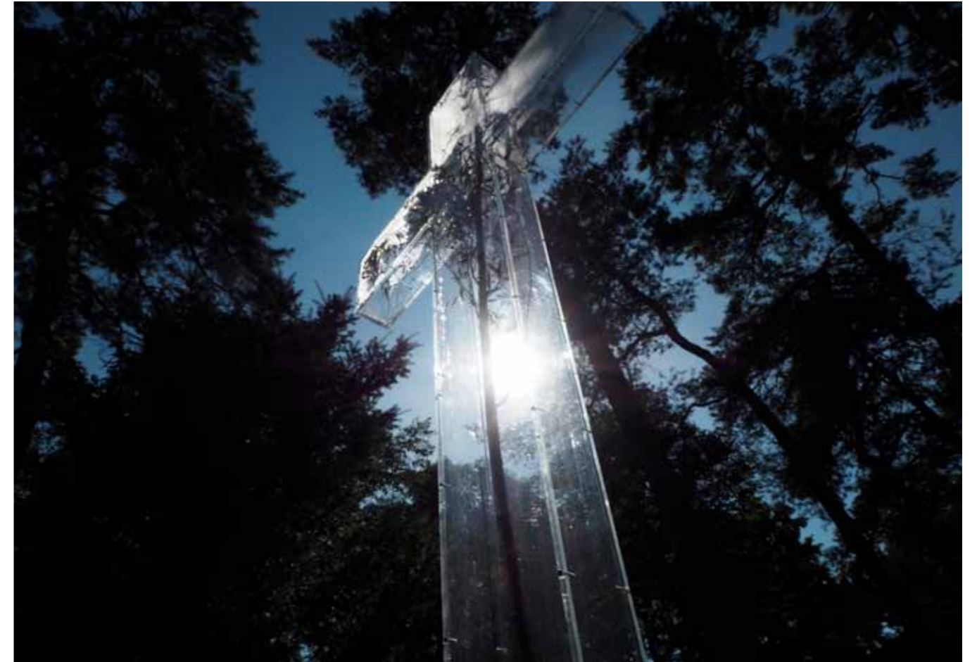
Wedergeboorte in Het Kruis