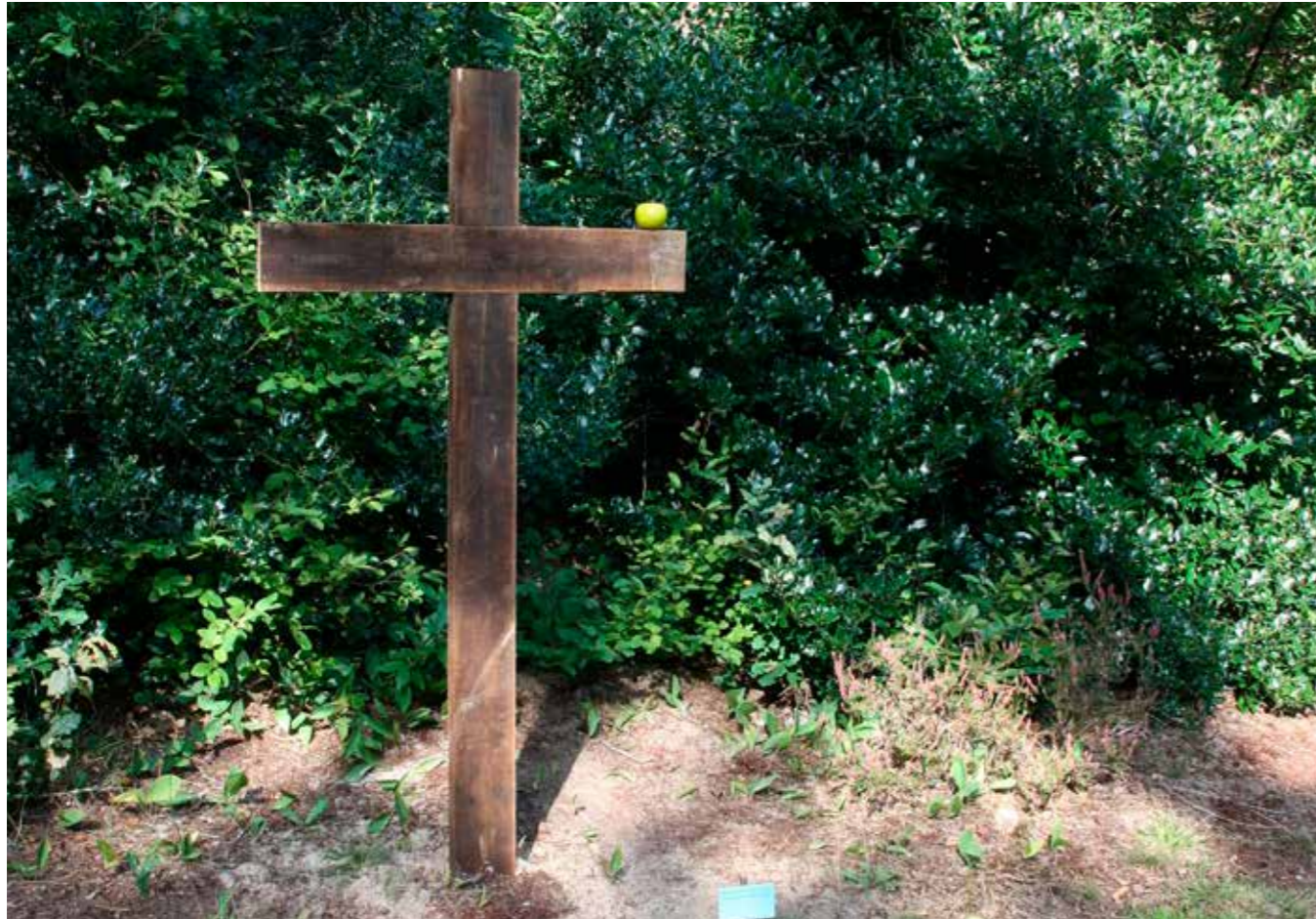
Zonde en Verlossing, Oordeel en Ervaring