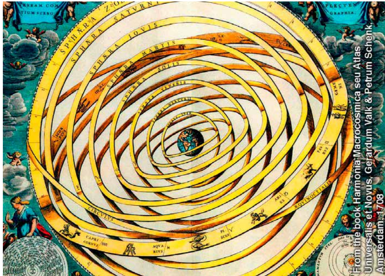
Kosmologie van Aristoteles

geen kunstwerk zijn eigenlijk? Omdat het proces of de methodiek van creatie verschillend is? Het is net zo goed een product van de verbeelding, langs een andere weg ontstaan dan de meeste kunst. De vroegere kosmologie van Aristoteles was weinig anders dan de Big Bang theorie, men maakte een model van de werkelijkheid, een verbeelding. Dit werd een tijdje verdedigd en toen kwam er weer een ander model. Zo zal het de Big Bang ook vergaan. Met de blik van vandaag kijken we naar de kosmos van Aristoteles als naar een kunstwerk. Zelfs al is de Big Bang theorie het resultaat van pure wiskunde, onder het volk wordt het verbeelding en wellicht tegen wil en dank worden de scheppers van de theorie alsnog kunstenaars.