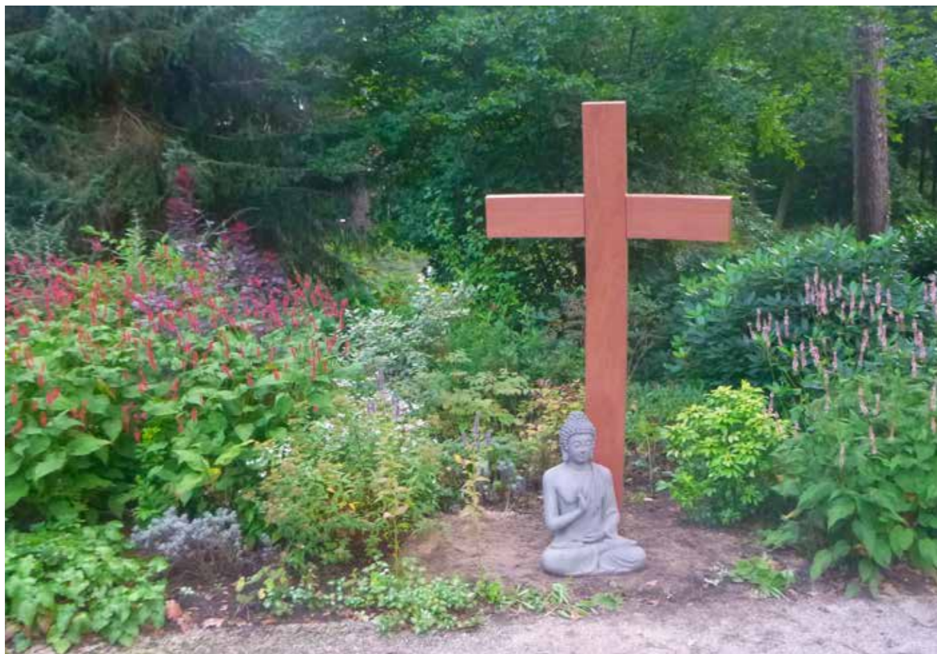
Wedergeboorte onder De Boom

E.T.A. Hoffman (Duitse staten, 18 e eeuw) neemt ons in zijn boeken mee naar het spanningsveld tussen fantasie en werkelijkheid en hoe de mens hier mee om kan gaan. Hij presenteert drie alternatieven om het spectrum mee op te zetten. Meestal aan de hand van relaties tussen man en vrouw. Zo is er de mogelijkheid zich te verliezen in de fantasie aan de ene kant: Eeuwig blijven smachten naar een vrouw die je één keer hebt ontmoet of hebt verloren. Aan de andere kant kan men zich verliezen in slechts de realiteit en als derde is er de poging om een soort verzoening te vinden. Daar zou je de droom een rol kunnen laten hebben als projectie van de innerlijke essentie die zich in de werkelijkheid wil manifesteren.