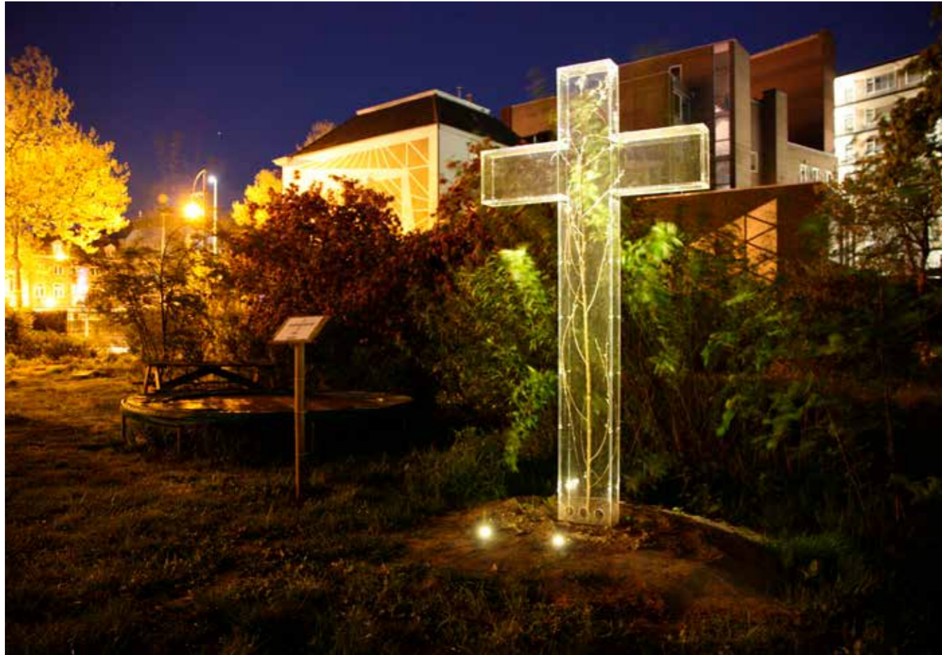
Wedergeboorte in Het Kruis

dit zelfs doortrekken naar het leven zelf. De grondhouding wordt beheersing. Overgave en vertrouwen aan het leven worden een grotere uitdaging. De mens krijgt hele nieuwe menselijke uitdagingen, een heel nieuwe vorm van religie is misschien wel het antwoord op deze uitdagingen. Mytholoog Joseph Campbell beschrijft in detail hoe de scheppingsverhalen, kunst en religie veranderen met de overgang van jager-verzamelaars naar de landbouwers. De mens komt in grotere hiërarchieën te leven, waar de een voor de ander werkt een heel leven lang. De verhouding tussen mensen neemt objectievere vormen aan dan bij de jager-verzamelaars.